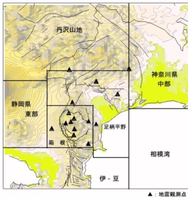
図2 表1に対応する地域区分