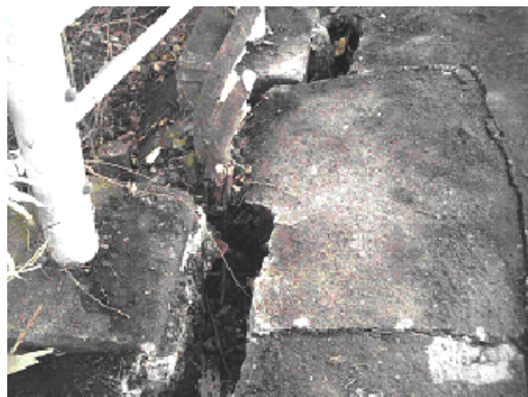
写真4 土留工、法面工では天端、法肩部の損傷、沈下が多かった。