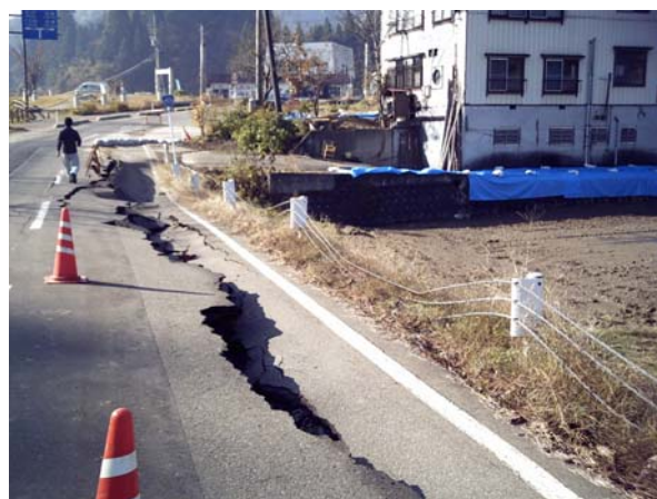
写真2 道路の盛土境界は、ほぼ例外なく被害が発生した。