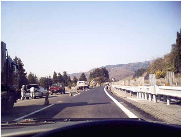
写真7 高速道路が最も早く機能を回復した。