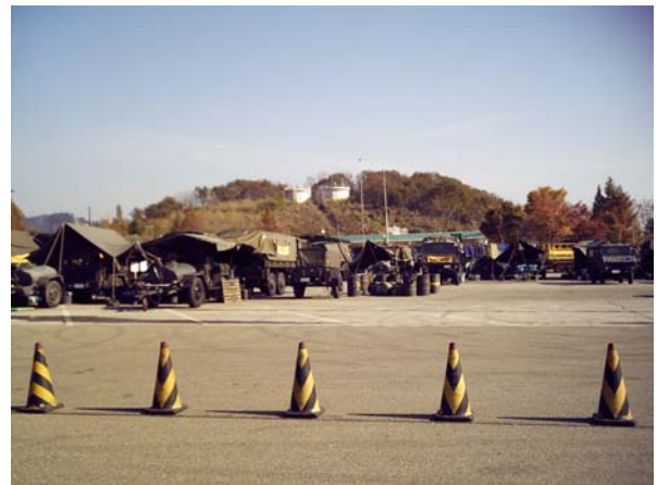
写真8 越後川口サービスエリアは災害支援基地に利用されていた。