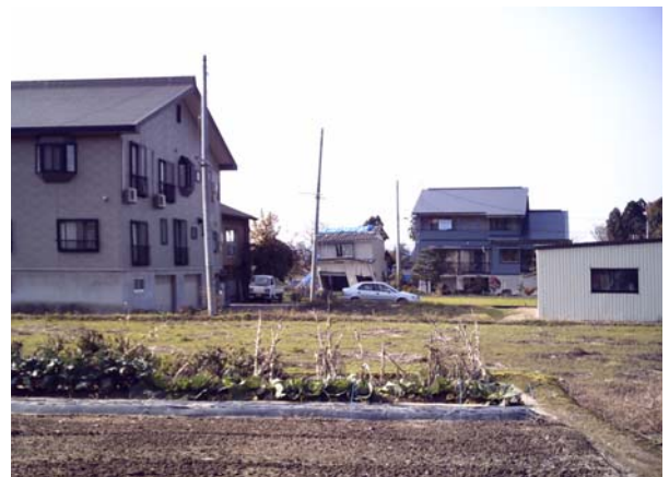
写真5 揺れの激しかった地区でも新しい住宅は比較的被害が小さい。

これらの調査結果をもとに、地震学的な知見をとり入れた災害予測の構築と危機管理面にもウェイトを置いた社会資本整備計画が急務と考えられます。