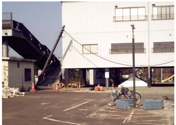
写真6 阪神淡路大震災のときは一階が駐車場となっている構造物が大きな被害を受けたが、今回の地震では、そのような傾向がみられなかった(左は液状化により甚大な被害を受けたJR越後滝谷駅)