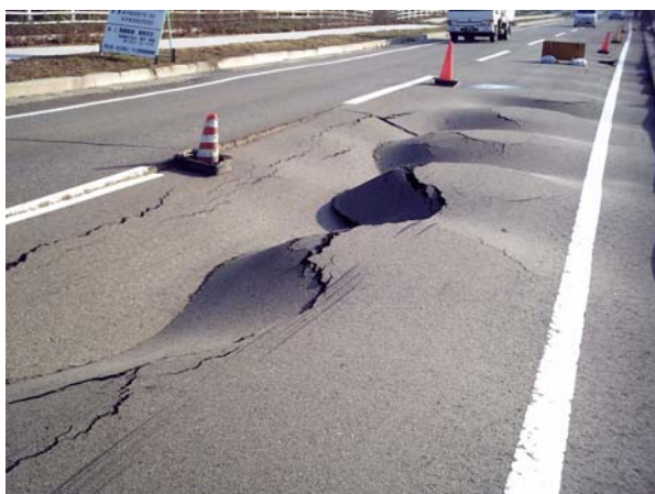
写真1 震源から約30km離れた柏崎市でも局所的に大きな被害が確認された。地質は軟弱な泥炭層で地盤改良も施されている場所である。

等値線は、本震のすべり分布を表している。外側の等値線は1.0m ~ 1.4m、内側は1.5m以上を示す。1.5m以上を示す等値線の目玉2カ所は、アスペリティーに対応する( 纈纈ほか、2004 )。南東側にある( 浅部の )アスペリティーが、特に被害が激しかった「激震ゾーン(ト部ほか、2004)」に一致している。