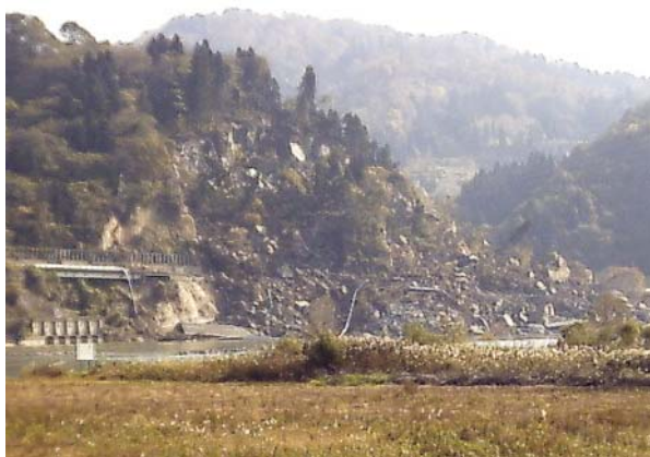
写真3 地震によって発生した長岡市妙見の岩盤崩壊

新潟県は全国的に地すべり地帯、軟弱地盤の多い県として有名ですが、地すべり防止対策、急傾斜地崩壊防止対策、軟弱地盤上の盛土安定検討等にあたって、地震外力を考慮した設計が義務付けられているケースは重要構造物や高さの高い擁壁(構造物)を伴う場合等、全体としては極めて限られたケースとおもわれます。もちろん、今回の地震外力は定められている設計基準外力を越えていますので耐震設計が施されていたとしても、結果として、どの程度、被害を少なくできたかについては、疑問が残るところでもあります。しかし、地震による土砂災害によって、これだけの損失が発生した以上は、やはり、今後の精査、検討課題のひとつになるものと言えそうです。