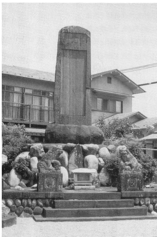
写真 1 下田隼人の碑

市当局や市民の県西部地震についての関心は大変高く、早くから防災無線の活用に積極的で、特に各家庭への個別の設置に努力が払われている。