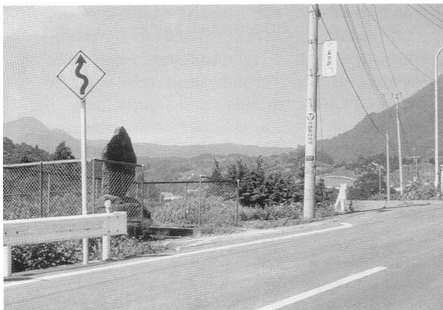
写真 2 川入堰碑

安政 2 年 10 月 2 日（1855 年 11 月 11 日）M6.9 安政江戸地震