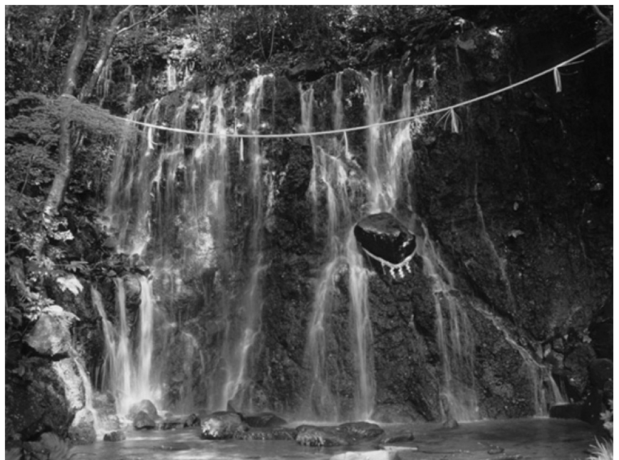
写真2 箱根町玉簾の滝 地層境界から湧き出る地下水

これからは、それだけではなく、ある程度滞在してじっくりとジオの魅力堪能していくツーリストも呼び込んでいくのがジオパークではないかと考えています。箱根には、その材料が豊富にあります。