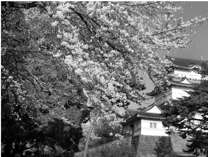
写真5 小田原市小田原城 火山岩が石垣に使われそこに歴史が刻まれる

ます。古くは石橋の合戦で敗れた源頼朝が箱根神社に匿って、その後鎌倉幕府が成立した後、二所詣されたという史実がありますし、後年地域を領有していた北条氏を討つために豊臣秀吉が石垣山に一夜城を築き滅ぼし時代は大きく変化していきまし、徳川時代には箱根の関所は幕府を守る関門でしたし、その徳川時代が明治時代が変わっていく際に戊辰戦争の一つである山崎の戦いが箱根で行われています。これらは一例