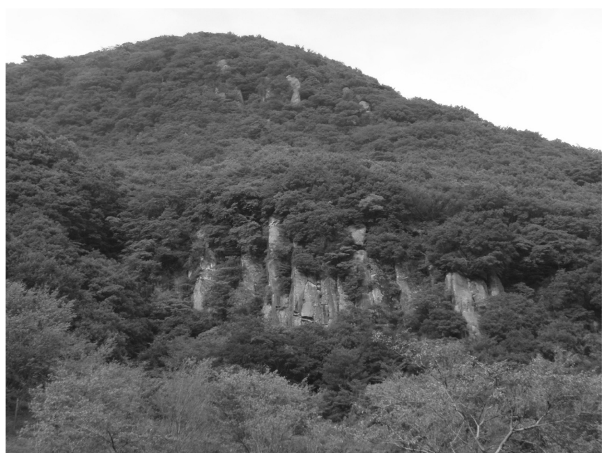
写真4 湯河原町幕山 安山岩の柱状節理がみごと

最後に、geopolitics: 地政学です。この単語は、主には国家間の政治や関係を地理的な要因から言及するためのものですが、国内政治における箱根は、歴史の様々な舞台上で登場し