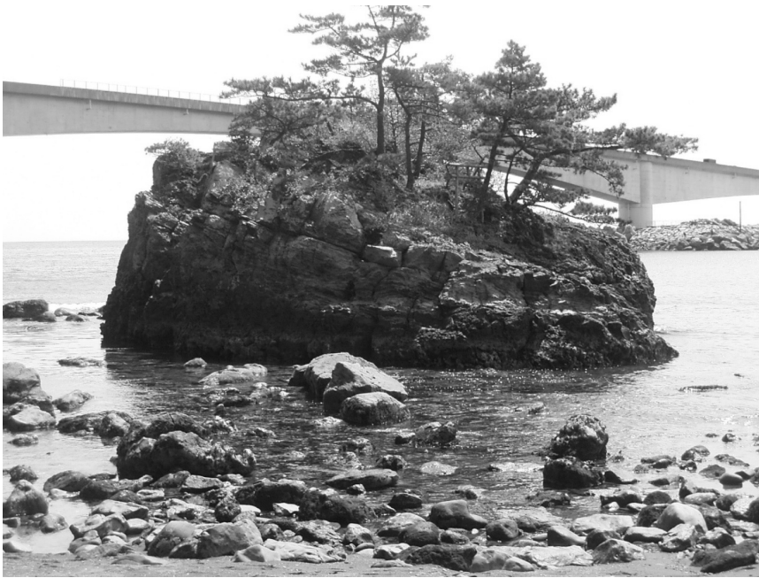
写真3 真鶴町岩海岸 溶岩が見られる海岸

現在、進めている認定への取組の中で、ジオサイトの候補となっている各所の幾つかの写真を掲載しましたが、それらを見ただけでもワクワクしてきませんか。(写真1～5)