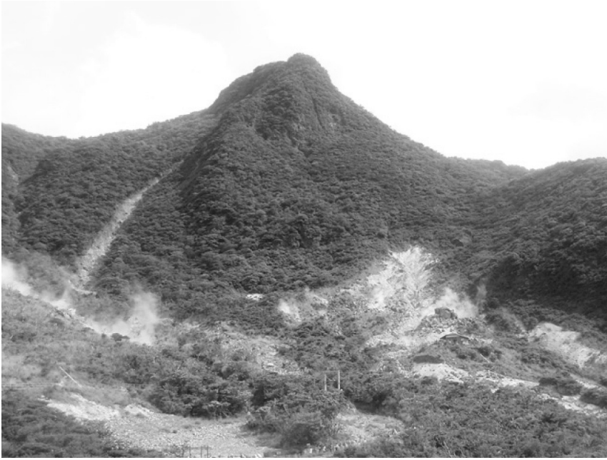
写真1 箱根町大涌谷と冠ヶ岳 現在も噴気をあげています